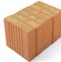
Porotherm 38 W.i Plan