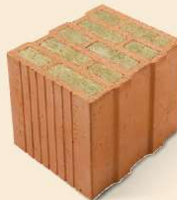
Porotherm 32 W.i Objekt Plan Sockelstein für die Fußpunktausbildung bei Porotherm 44 und 38 W.i Objekt Plan