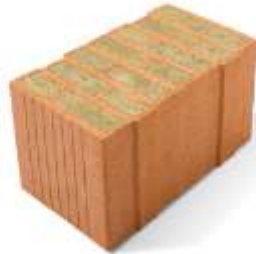
Porotherm 44 W.i Plan