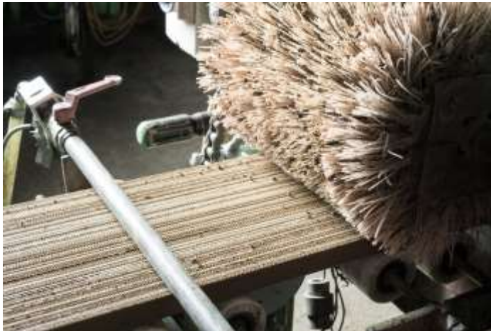
Oberfläche wird aufgeraut