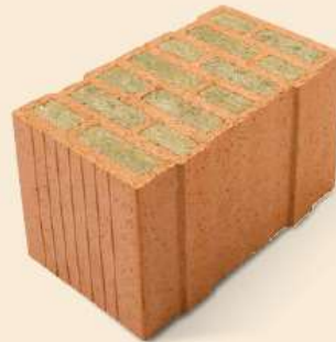
Porotherm 44 W.i Objekt Plan Wanddicke 44 cm U-Wert ab 0,16 W/m 2 K verputzt