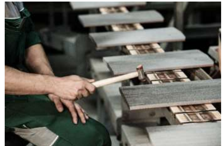
Qualitätskontrolle - Klangprobe