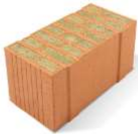
Porotherm 50 W.i Plan