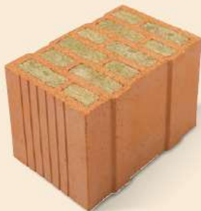
Porotherm 38 W.i Objekt Plan Wanddicke 38 cm U-Wert ab 0,19 W/m 2 K verputzt