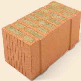
Porotherm 50 W.i Objekt Plan Wanddicke 50 cm U-Wert ab 0,15 W/m 2 K verputzt