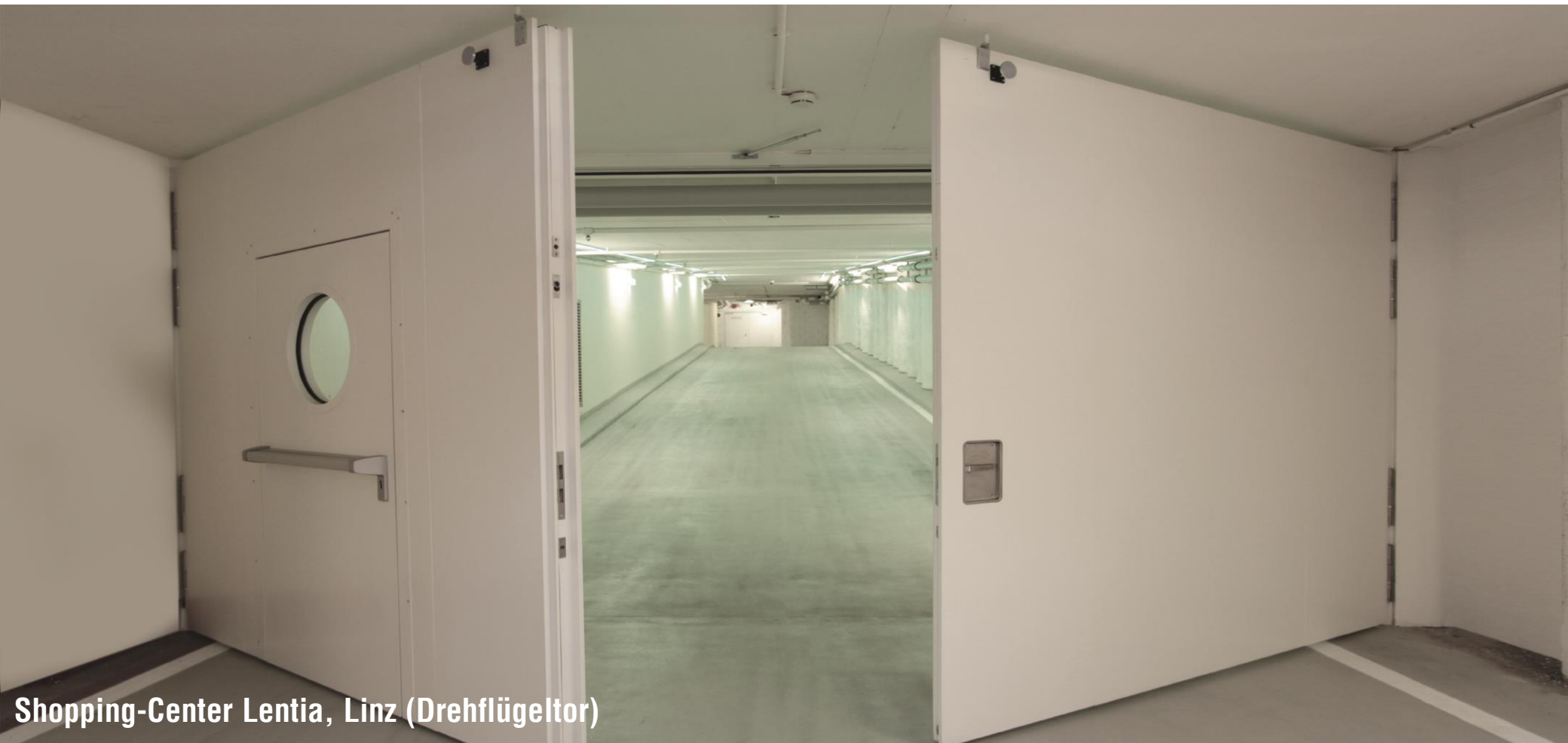
Shopping-Center Lentia, Linz (Drehflügeltor)