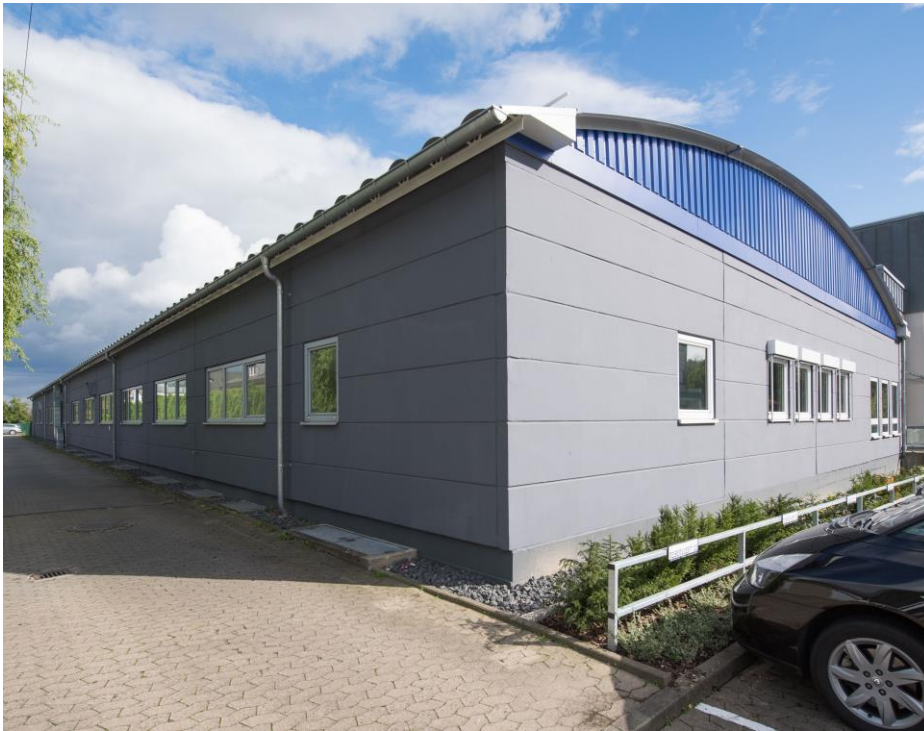
Krautzberger GmbH, Eltville am Rhein