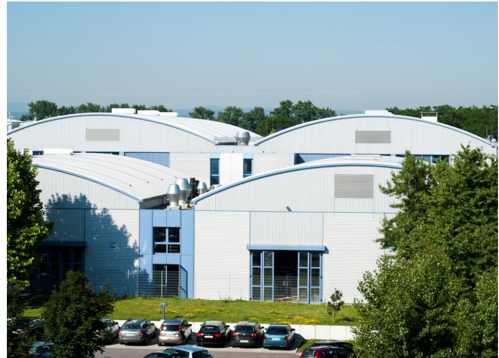
Araymond, Weil am Rhein