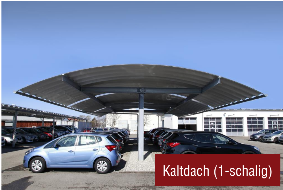
Autohaus Sangl, Landsberg am Lech